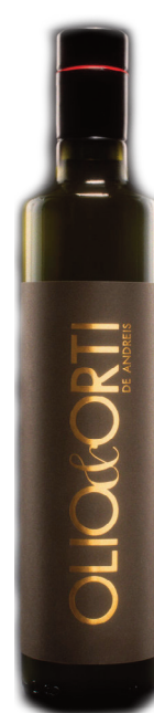
Baladin Olio Extra Vergine Bio Olive 0,50 x 6 // 3L