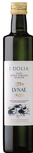
Lunae Olio Extra Vergine Olive 0,50 x 6