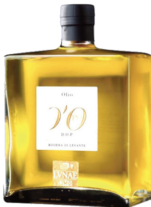
Lunae D'or Olio Extra Vergine Olive 0,50 x 6