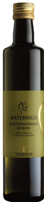
Tedeschi Olio Extra Vergine Olive 0,50 x 6