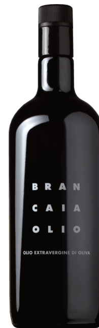
Brancaia Olio Extra Vergine Olive 0,50 x 6