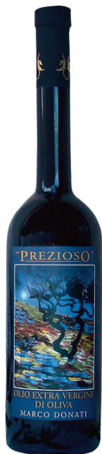
Donati Olio Extra Vergine Bio Olive 0,50 x 6